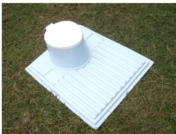
Letrina MI-36 vista superior