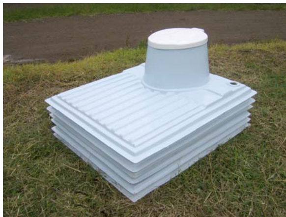
Letrinas MI-36 apiladas