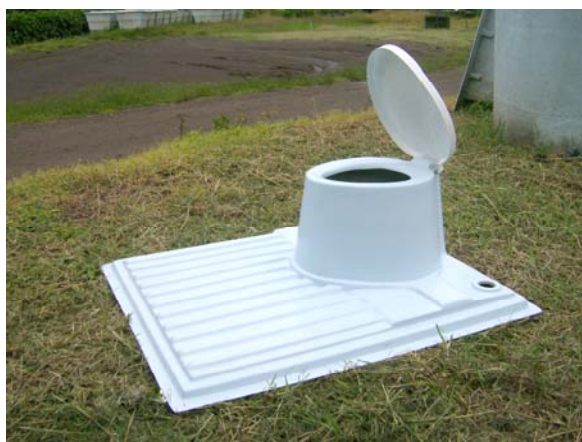
Letrina MI-36 con tapa abierta